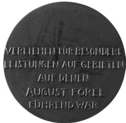
August-Forel-Medaille (nat. Größe) gestaltet von Karl Dautert, Berlin 1937