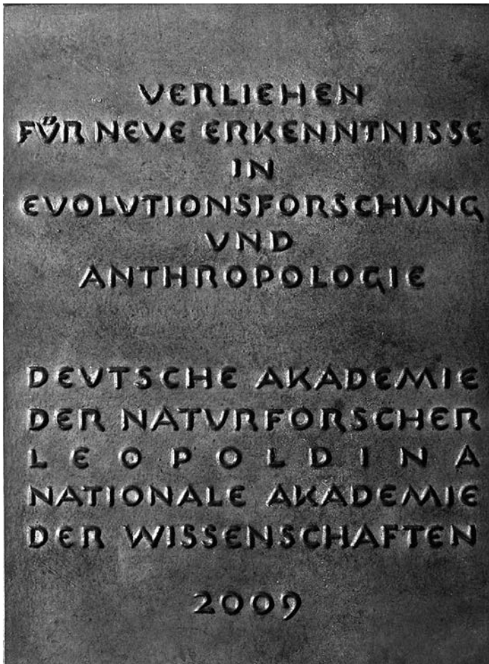
Rückseite der Darwin-Plakette 2009 gestaltet von Prof. Bernd Göbel, Halle (S.)