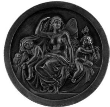
Carus-Medaille (nat. Größe) | Carus Medal (real size)

Ende 1846 graviert von Friedrich Ulbricht (Dresden) nach dem von Carus' Schwiegersohn Ernst Rietschel (1804–1861) geschaffenen Reliefprofil (1846). Die Rückseite der Medaille zeigt eine ebenfalls nach Rietschels Entwurf gestaltete Psyche mit den Genien des bewußten und des unbewußten Lebens. 1846 war Carus' psychologisches Hauptwerk »Psyche. Zur Entwicklungsgeschichte der Seele« erschienen, in dem das Leben der Seele als ein »immerwährendes Schweben zwischen Unbewußtsein und Bewußtsein« dargestellt ist.