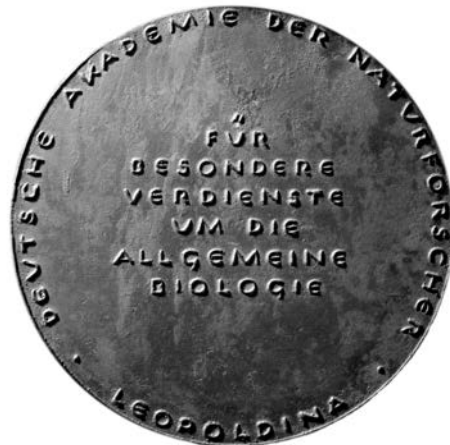
Mendel-Medaille (2/3 nat. Größe) gestaltet von Bildhauer Gerhard Lichtenfeld, Halle (S.) 1967