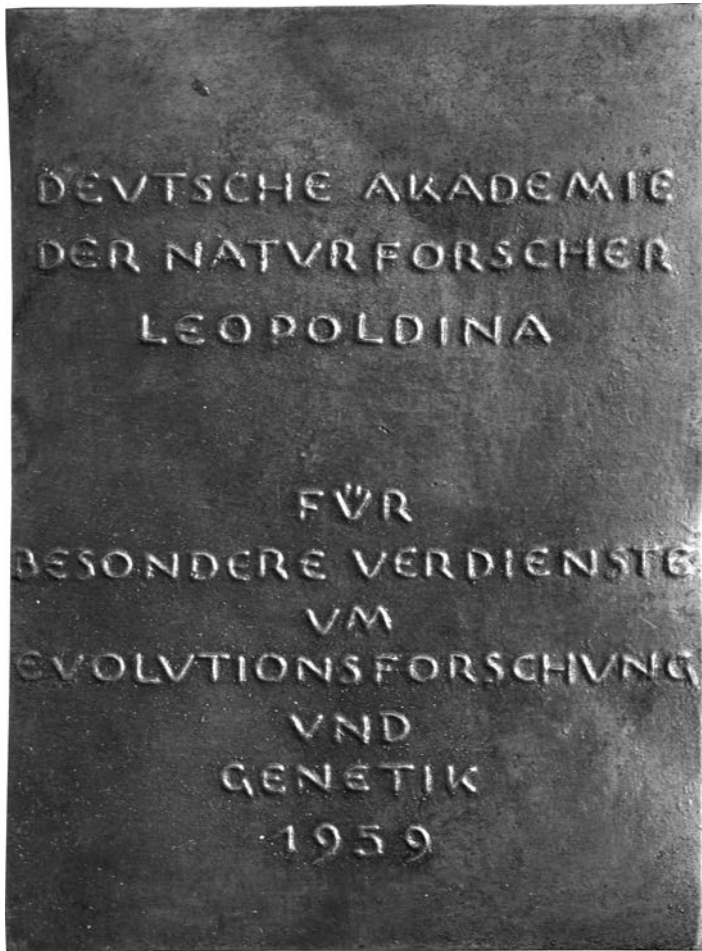
Rückseite der Darwin-Plakette (nat. Größe)