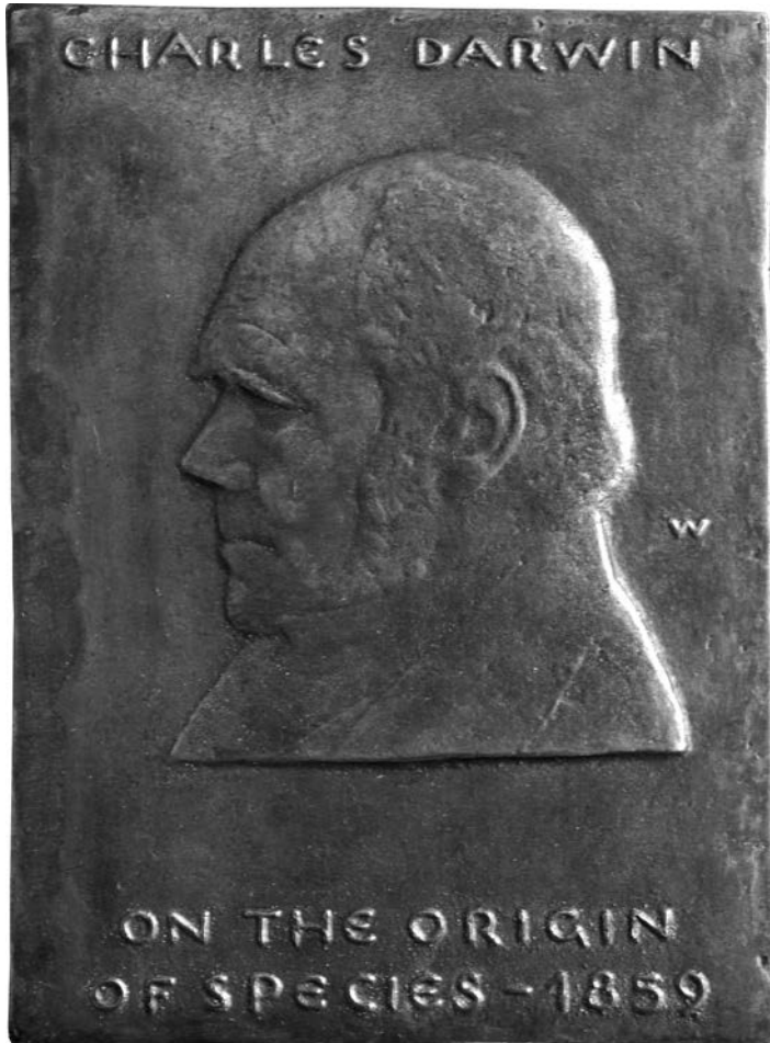
Vorderseite der Darwin-Plakette (nat. Größe) gestaltet von Prof. Gustav Weidanz, Halle (S.) 1959