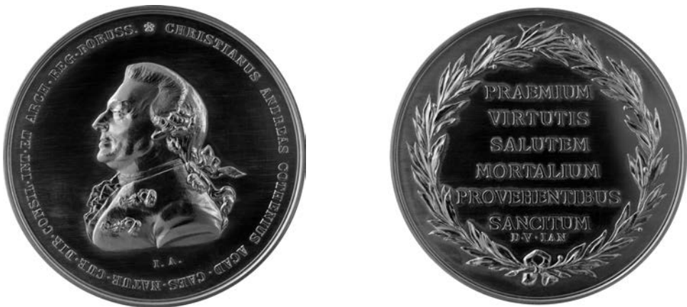
Cothenius-Medaille (nat. Größe) | Cothenius Medal (real size)