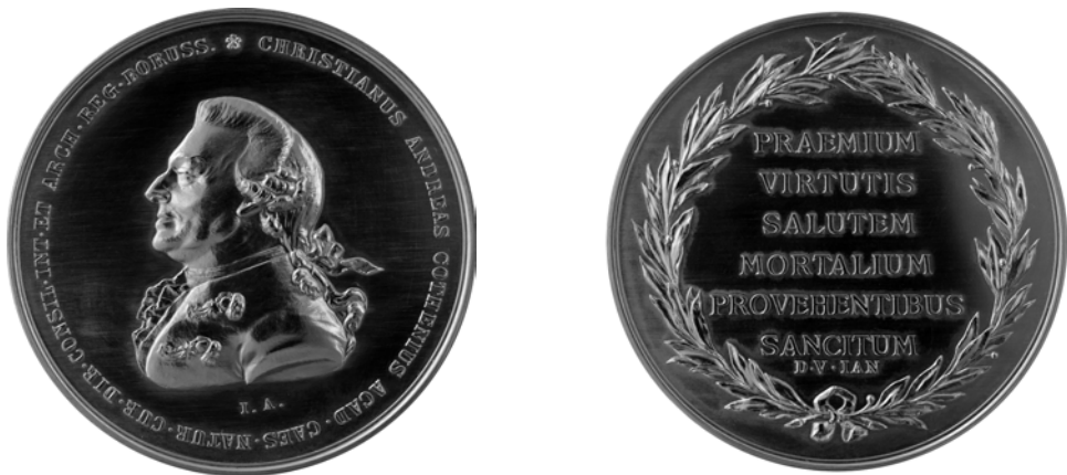
Cothenius-Medaille (nat. Größe) | Cothenius Medal (natural size)

Christian Andreas von Cothenius (1708 – 1789), member and XIII Director Ephemeridum of the Academy, in his Last Will and Testament, left the Academy 1000 gold thalers directing that the interest earned from the assets was to be rewarded to whoever found the best solution to a prize question in the field of practical medicine, with a commemorative coin decorated with the effigy of its founder. The template for the medal was designed by the Berlin engraver Jacob Abraham (1723 – 1800) during Cothenius' lifetime.