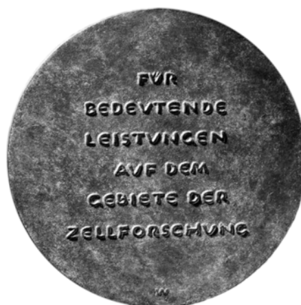
Schleiden Medaille, gestaltet von Prof. Gustav Weidanz (Halle) 1955 (2/3 nat. Größe)